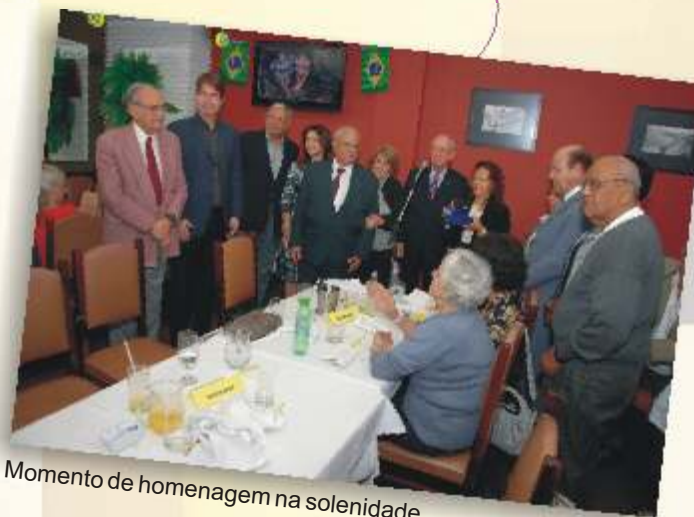
Momento de homenagem na solenidade