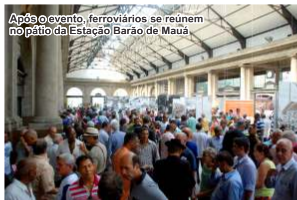
Após o evento, ferroviários se reúnem no pátio da Estação Barão de Mauá

O evento contou com significativo número de ferroviários, que lotaram o auditório e as escadas de acesso.