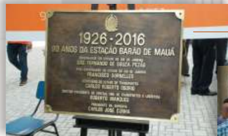
Placa comemorativa aos 90 anos da Estação Barão de Mauá