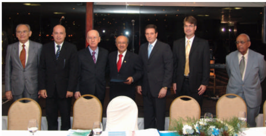
Mesa solene do Jubileu de Prata da Associação dos Aposentados da RFFSA