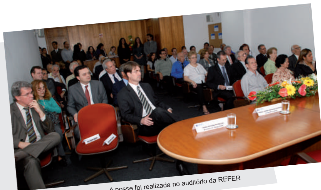
A posse foi realizada no auditório da REFER